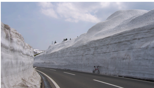
Walls of snow along road in Japan

February 1, 2011: I started out very well with the first ride on my trip to Noda city in Chiba prefecture, just east of Tokyo. The purpose of this trip was to attend a fellowship meeting at 7 PM. It was good weather and I left home at a very good time, just after 10 AM. Tokyo is 300 kilometers away but it usually takes me less than 6 hours, only half a day. I found that weekends